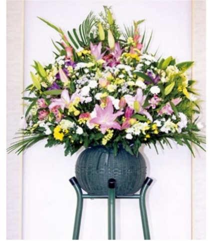
6 時期により花の種類や色は異なります。容器やスタンドが異なる場合があります。 1基 22,000 円 (税込)