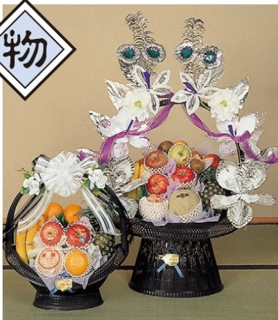
季節により果物の内容が変わります。 9 1籠 5,940 円 (税込)