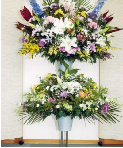
5 時期により花の種類や色は異なります。 1基 33,000 円 (税込)