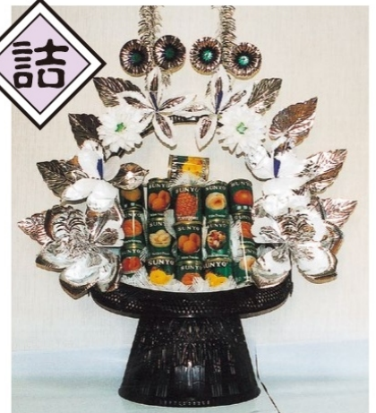
11 缶づめの盛カゴ 1籠 11,880 円 (税込)