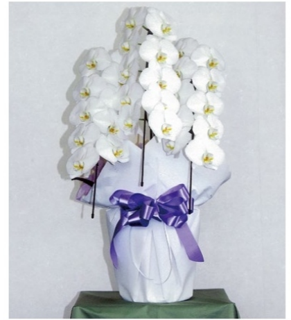
8 季節により少し大きさが変わる場合があります。 1基 27,500 円 (税込)