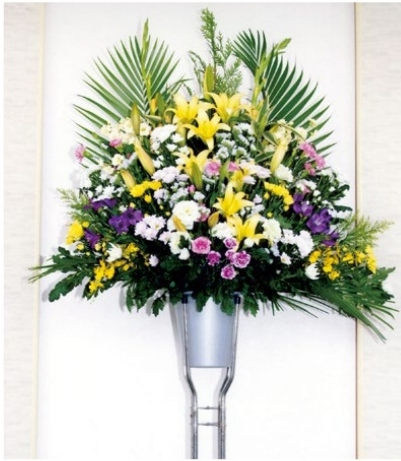
7 時期により花の種類や色は異なります。 1基 16,500 円 (税込)