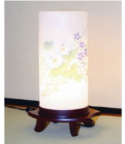
3 つむぎ(芙蓉) 高さ38cm