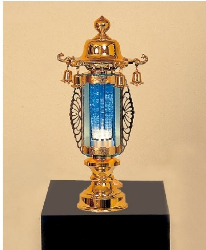
2 7号 バブル灯