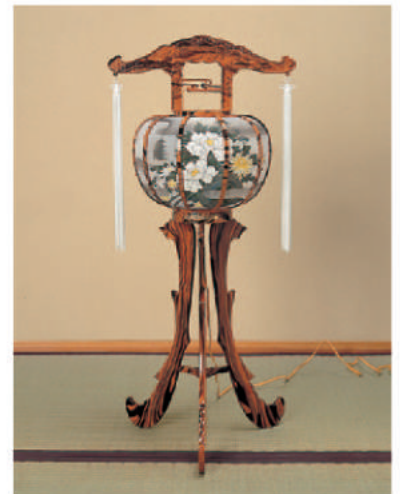
5 高さ82cm 11,880 円