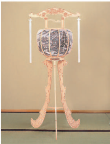
3 高さ96cm 16,200 円