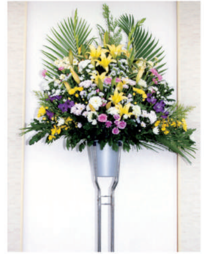
10 10,800 円