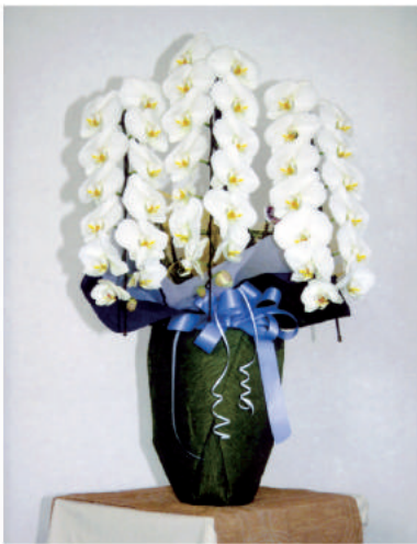
11 16,200 円