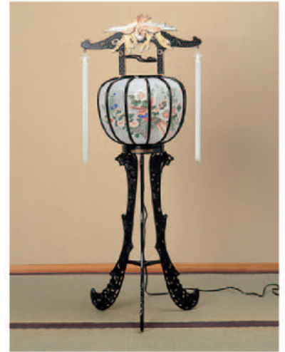
2 高さ100cm 16,200 円