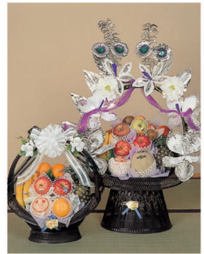
13 14 季節により果物の内容が変わります。⑬ 5,400 円 ⑭ 10,800 円