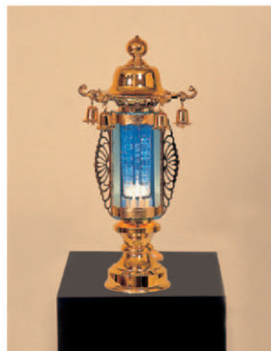
7 高さ31cm 12,960 円