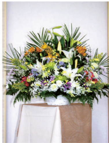
12 10,800 円