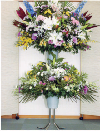
8 21,600 円