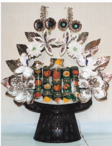
15 缶づめの盛カゴ 10,800 円