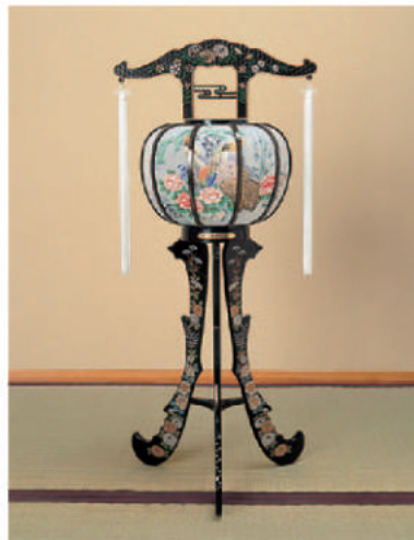
4 高さ82cm 12,960 円