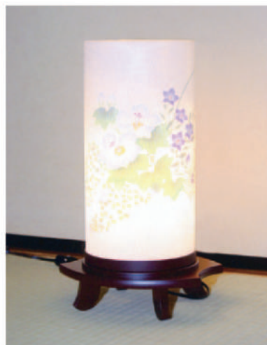
6 高さ38cm 16,200 円