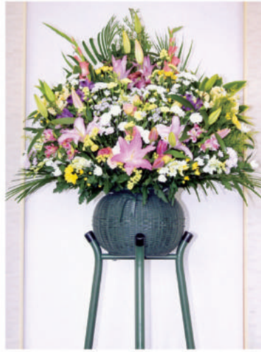
9 16,200 円