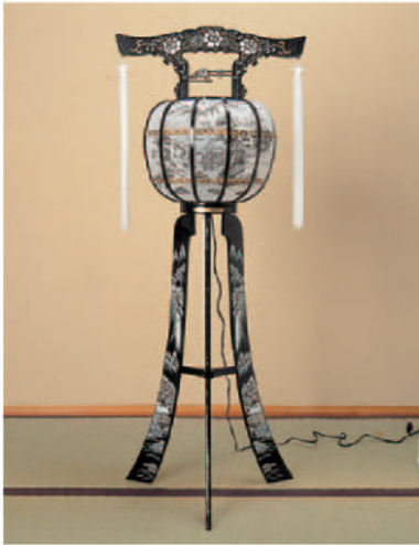
1 高さ120cm 21,600 円