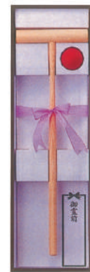
18 ゲートボール 905×265×84mm